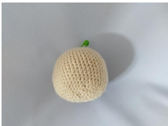
1 fertiger Kopf