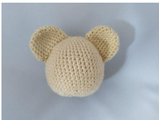
2 angenähte Ohren