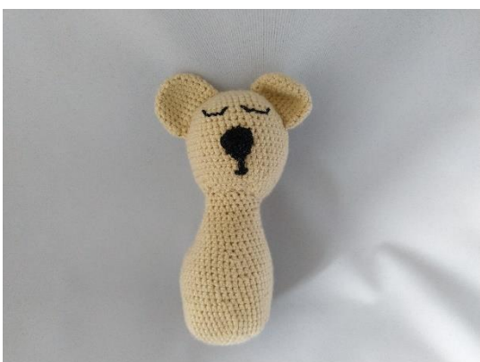
4 Körper angenäht