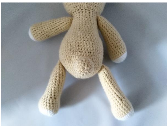
8 Schwänzchen angenäht

Rd. 22: *3 fM, abn.* 3 x 12 Rd. 23: *abn.* 6 x 6