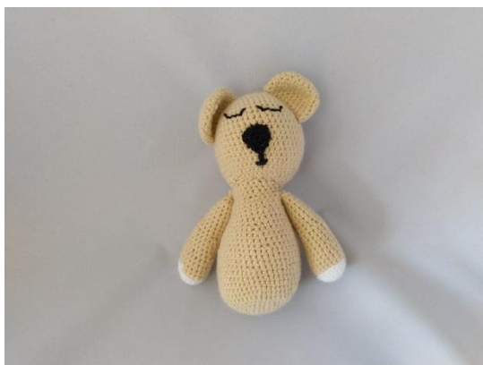
5 Arme angenäht