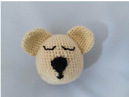
3 Nase mit aufgestickten Augen/Mund