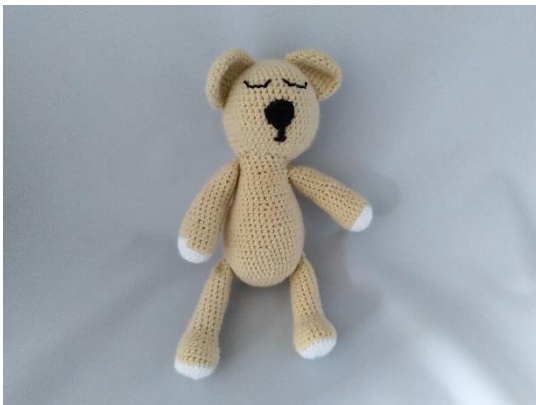
7 Beine angenäht